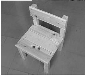
ミニイスを作ります。