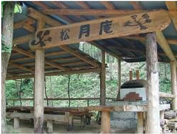
ぜひご利用下さい