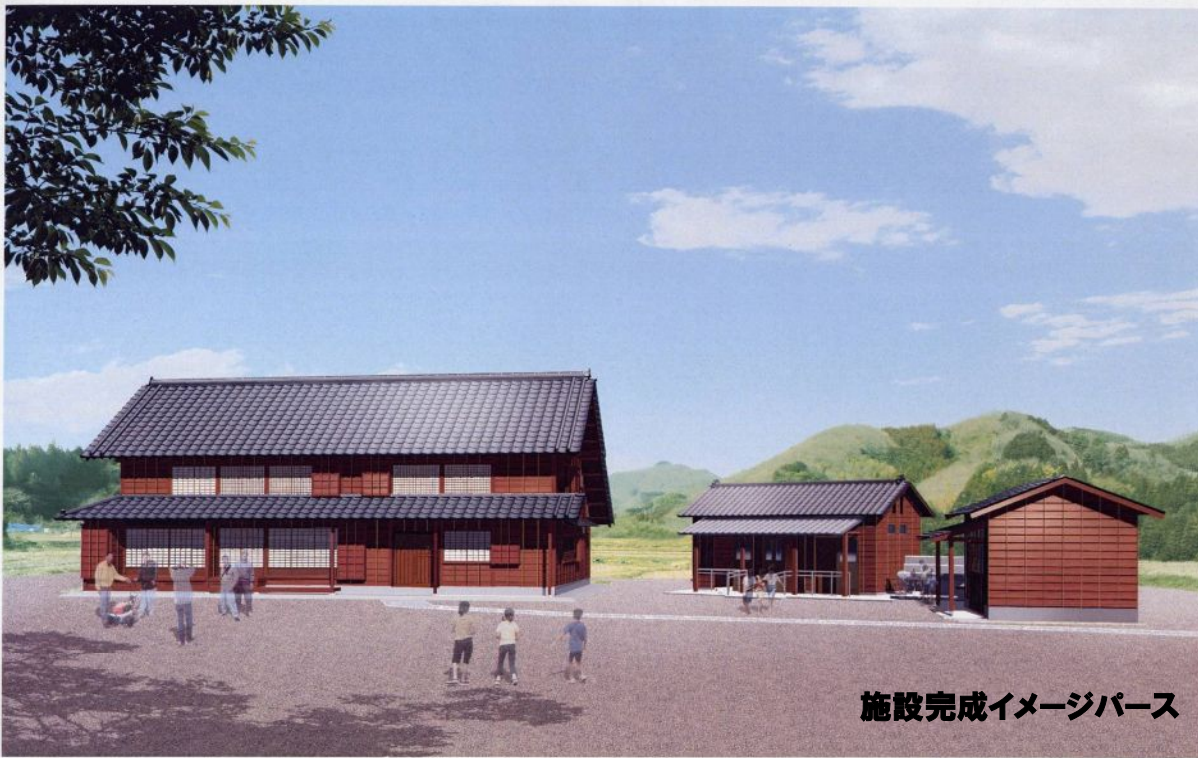
施設完成イメージパース